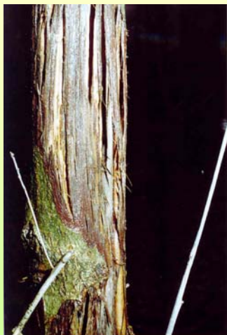
„Angstreiserbildung“ nach großflächiger Sommerschäle