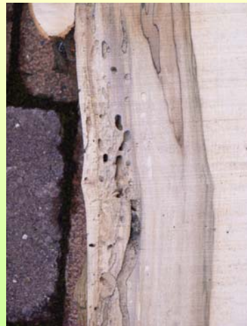
Infolge Pilzeinfluss komplett auflösender Holzkörper