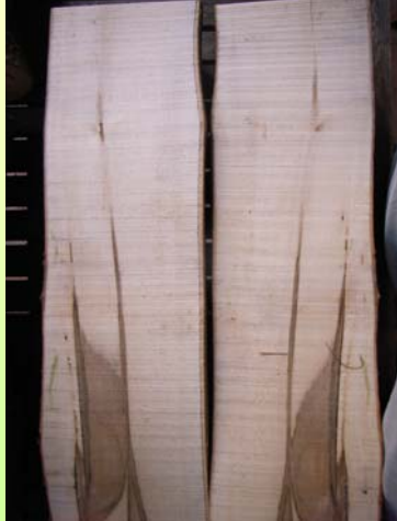
Komplett überwallter, rd. 5 Jahre alter Sommerschältschaden