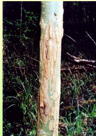
2 und 3 Jahre alte Sommerschäle