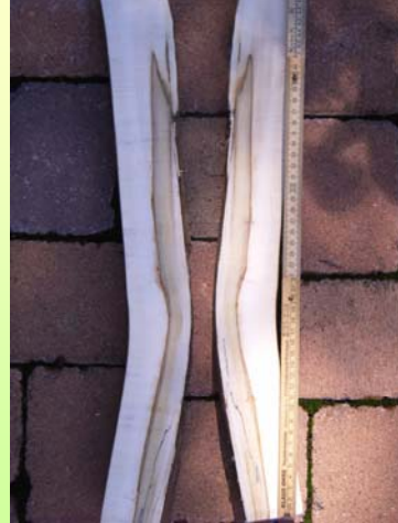
Deutliche Verfärbung des Schadens im Aufschnitt