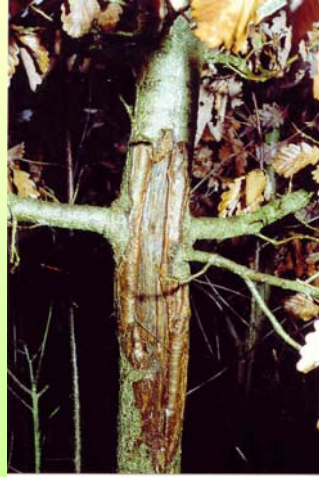
Rd. 3 Jahre alte Sommerschäle