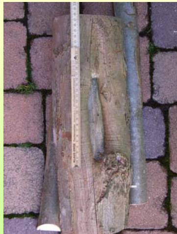
Rd. 10 Jahre alter, offener Sommerschältschaden