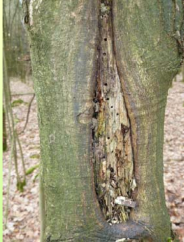
Rd. 6-8 Jahre alter Sommerschälenschaden

Infolge Pilzeinfluss sich komplett auflösender Holzkörper