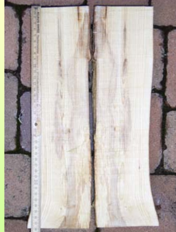
Rd. 2 Jahre alter Sommerschältschaden