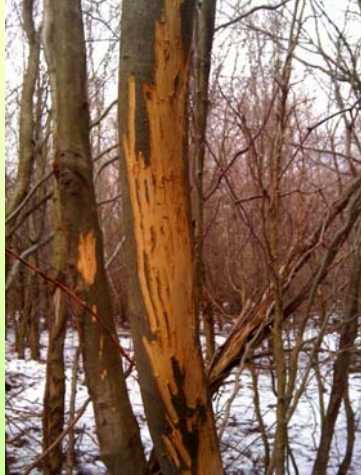
Wenige Tage alter Frühjahrs-schältschaden aus dem März