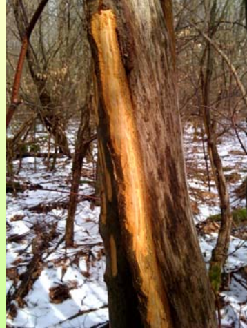
Schälung einer alten Überwallungswulst