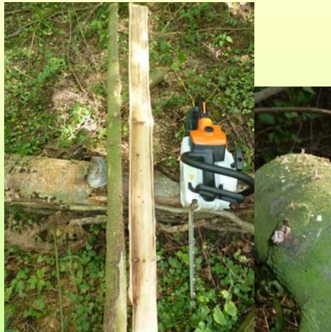
Querschnitt 2,5 m Höhe