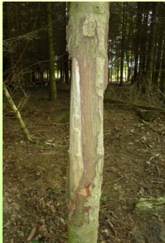
Rd. 8jähriger Sommerschäle