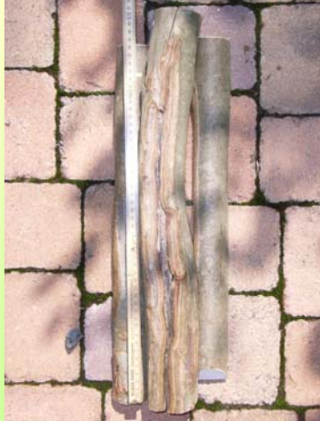
Rd. 3 Jahre alter Sommerschältschaden